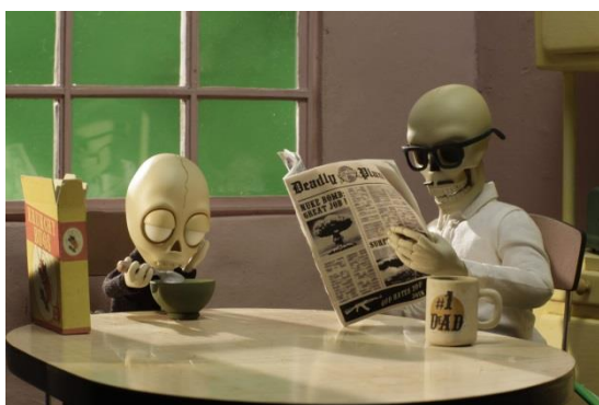
Les arts décoratifs, Galerie des jouets, exposition « Winshluss. Un monde merveilleux », avril-novembre 2013