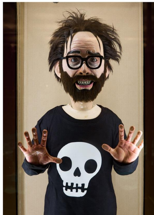
Les arts décoratifs, Galerie des jouets, exposition «Winshluss. Un monde merveilleux», Avril/Novembre 2013

www.franceculture.fr/emissions/paso-doble-le-grand-entretien-de-lactualite-culturelle/winshluss-les-contes-de-notre